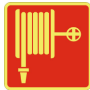
SL37 Lancia antincendio