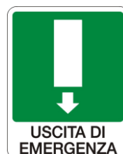
S4 Uscita di emergenza