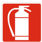
S6 Estintore portatile o carrellato