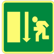
SL32 Percorso di esodo diritto e avanti