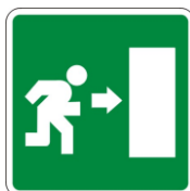
S3 Percorso di esodo verso destra