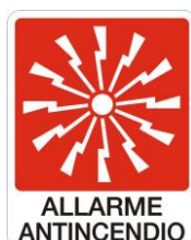
S8 Pulsante di segnalazione incendio