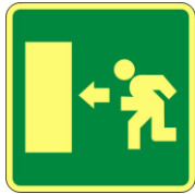
SL31 Percorso di esodo verso sinistra