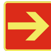
SL39 Direzione per trovare le attrezzature antincendio