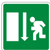
S2 Percorso di esodo diritto e avanti