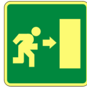
SL33 Percorso di esodo verso destra