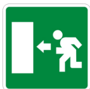
S1 Percorso di esodo verso sinistra

La lettera C , affiancata alla S , indica i cartelli composti.