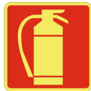
SL36 Estintore portatile o carrellato