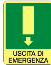
SL34 Uscita di emergenza