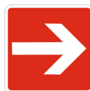
S09 Direzione per trovare le attrezzature antincendio