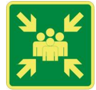
SL35 Punto di raccolta