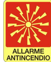
SL38 Pulsante di segnalazione incendio