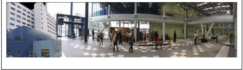
G.B. Morgagni – L. Pierantoni Hospital – Forlì, ITALY