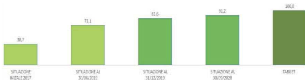
andamento PDA index regionale 2017-2020

I risultati conseguiti sono stati realizzati con gradualità progressiva anno dopo anno sui diversi aspetti innovativi introdotti e sono stati monitorati regolarmente con un sistema condiviso di raccolta di alcuni indicatori che esplicitano i progressi via via raggiunti dalle aziende e che possono essere sintetizzati con un indice globale (PDA index); l'andamento di tale indice sintetico, che è riportato nel grafico sottostante, mostra l'importante percorso di miglioramento che è stato realizzato in questi anni.